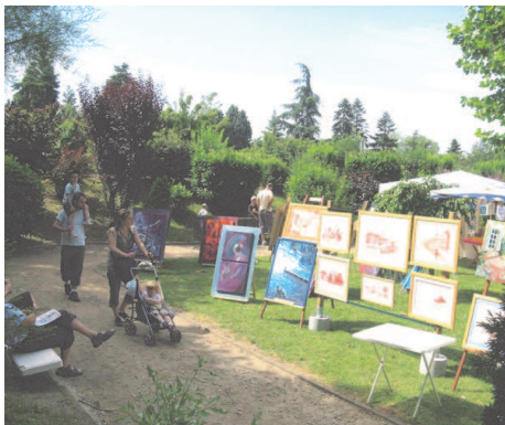
L'Art au Village de St Bernard

cadre exceptionnel de Saint-Bernard. La place du village sous les platanes entre l'église et le château donnait toute la tranquillité voulue pour admirer et, le cas échéant, acheter en fonction du « coup de foudre » les œuvres de tous genres.