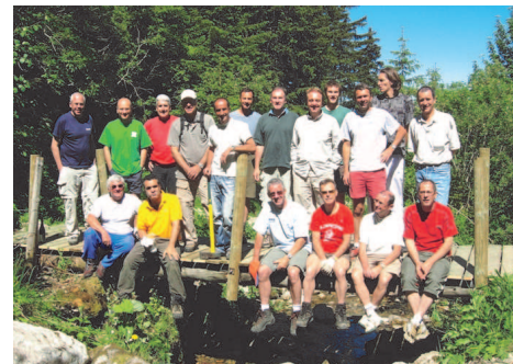
Test de résistance » du nouveau pont de l'Ugine

Tous les habitués de la DENT D'OCHE auront la surprise de découvrir un nouveau pont tout neuf sur l'itinéraire de montée. Un samedi, les membres du club ont reconstruit le pont fortement endommagé à la sortie du bois au-dessus du restaurant la FE-TUIERE.