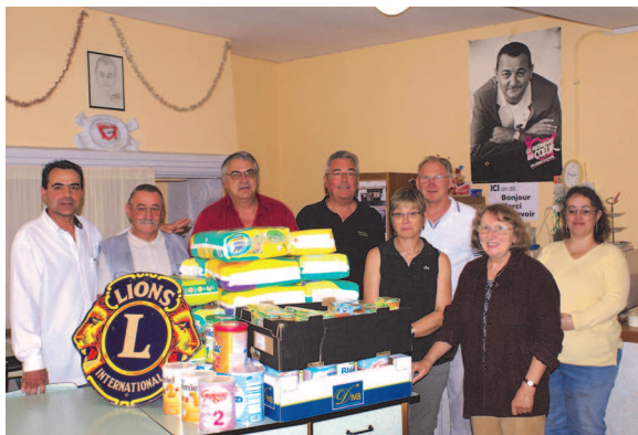
Thiers soutient les enfants des Restos du Cœur

Souhaitant ne pas se désolidariser de l'opération « Chariots Bébé », le Club réserve une partie des recettes (500 € cette année) pour l'achat d'aliments et de produits d'hygiène pour les nourrissons des familles prises en charge par les Restos du Cœur.