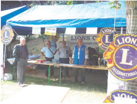
La Buvette de Givors

Avec 5 enfants de Brignais, ce sont 8 enfants auxquels le club a permis d'aller passer une semaine à Valloire, du 23 au 30 juillet, dans le cadre de l'action « Vacances Plein Air Lions de France ».