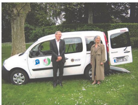
Véhicule aménagé pour le transport des handicapés