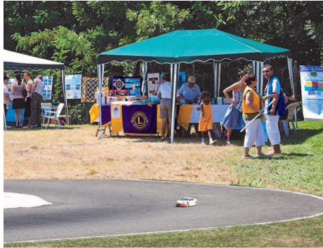
POLE POSITION : course de voitures radiocommandées

Des courses de voitures radiocommandées, reproductions exactes de voitures de course et légères, de motos et de « monster trucks », ont été organisées sur le circuit de Montbonnot, près de Grenoble. Plus de soixante pilotes sont venus disputer des épreuves sur chacune des pistes et ont effectué des démonstrations époustouflantes.