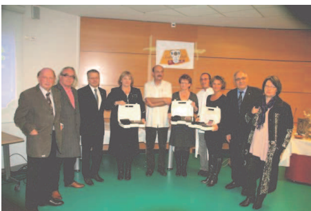
La remise des pompes à morphine à eu lieu le 22 février 2011 à l'I.C.L.

Dix grands chefs ligériens et de la région ont apporté leur contribution, en réalisant 700 litres de soupe au zénith de St Etienne lors de la venue d'un artiste de grande renommée.